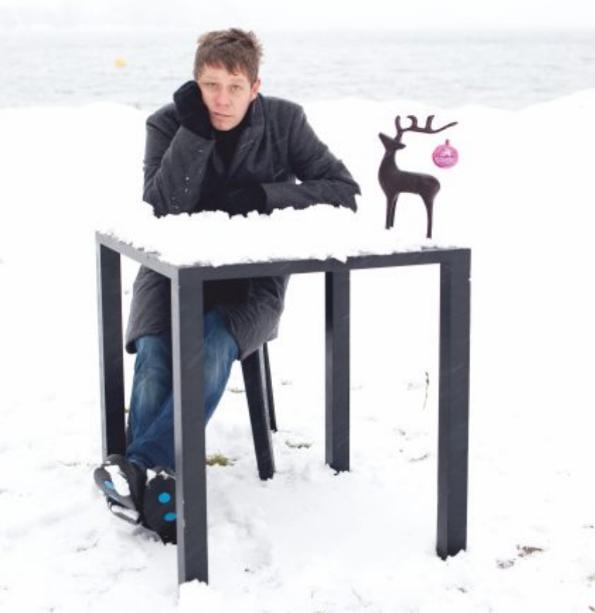
Jess Jochimsen