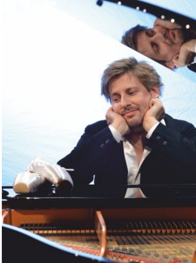
Daniel Helferich