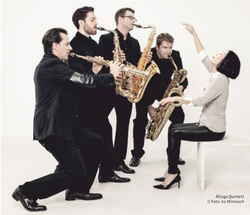
Alliage Quintett